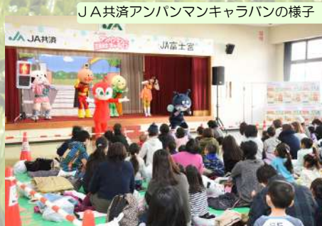
JA 共済アンパンマンキャラバンの様子