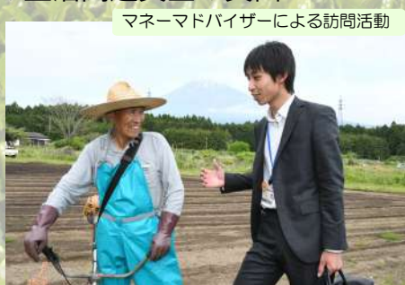
マネーマドバイザーによる訪問活動