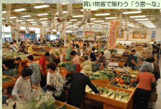
買い物客で賑わう「う宮〜な」