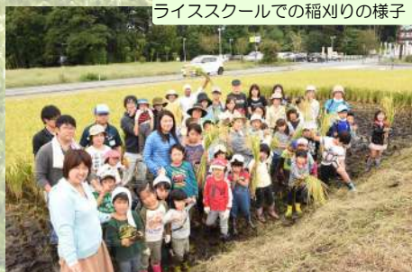
ライススクールでの稲刈りの様子