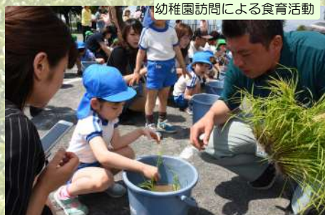
幼稚園訪問による食育活動