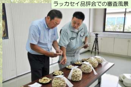
ラッカセイ品評会での審査風景